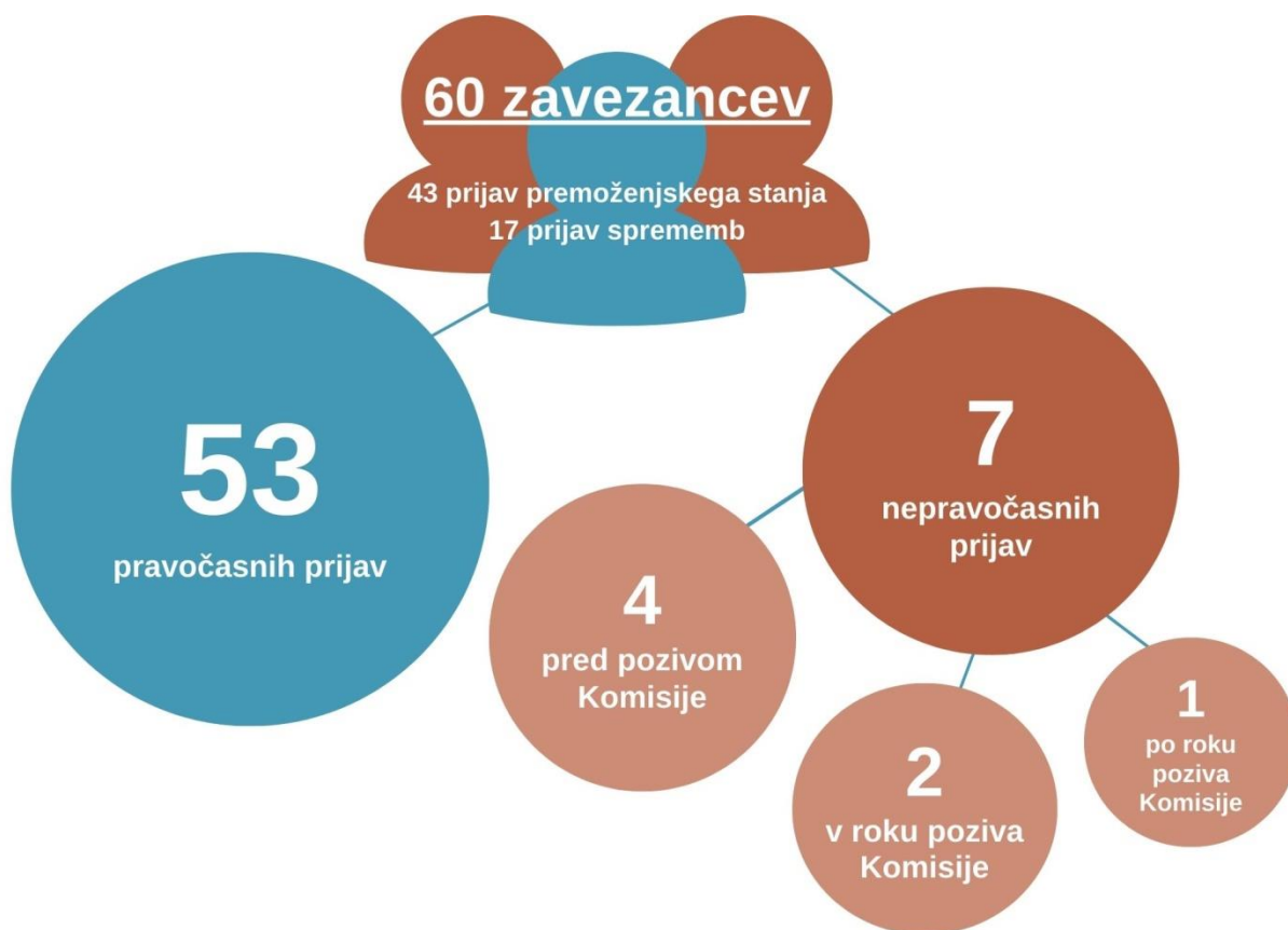
Graf 2: Kategorije zavezancev za poročanje premoženjskega stanja v Vladi RS, Generalnem sekretariatu vlade, Kabinetu predsednika vlade ter ministrstvih