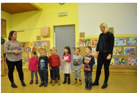
Kulturni program ob zaključnem dogodku v Vzgojno varstvenem zavodu Slovenj Gradec - vrtec Maistrova.

Tak ustvarjalni natečaj smo kot pilotni projekt izvedli že leta 2014 z Vrtci Občine Žalec, z naslovom »Korupcija ali poštenost?«, odlični odzivi in številni izdelki pa so nas spodbudili, da smo letos k projektu povabili vse slovenskih vrtce. Odzvalo se je šest vrtcev oziroma skupin vrtcev, Vrtec Ivana Glinška Maribor – enota Smetanova, Vzgojno varstveni zavod Slovenj Gradec – enote Maistrova, Podgrad in Šmartno, Vrtci občine Žalec in Vrtec La Coccinella Piran pa so projekt izvedli še pred zaključkom letošnjega leta, in s tem omogočili izpeljavo zaključnih dogodkov na lokacijah vrtcev v okviru aktivnosti mednarodnega dneva boja proti korupciji. Projekt naj bi izvedli v prvi polovici prihodnjega leta še v vrtcu Pedenped v Ljubljani ter vrtcu Ciciban Novo Mesto.