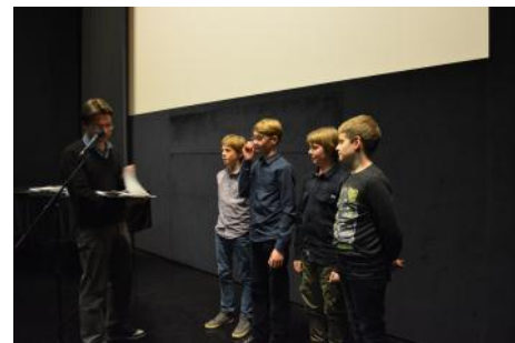
Nagrajenci na zaključni slovesnosti v Kinoteki

Po zaključku natečaja letošnjega oktobra je filmčke pregledala tričlanska natečajna komisija in izmed njih izbrala tri zmagovalne filmčke (OŠ Bizeljsko – film brez naslova, OŠ Gornja Radgona – »Igra odraslih«, in OŠ Grad – »OŠ Grad ima talent«) in še dva (OŠ narodnega heroja Rajka – filma »Korupcija v razredu« ter »Podkupljeno tekmovanje«), ki sta si zaslužila posebno omembo. Avtorji izbranih filmčkov bodo lahko za nagrado na eni od sodelujočih slovenskih srednjih šol z medijskim programom - Srednji medijski in grafični šoli Ljubljana, Srednji šoli za oblikovanje Maribor, Ekonomski šoli Novo mesto in Ekonomski gimnaziji in srednji šoli Radovljica - svoj filmček profesionalno posneli z dijaki in mentorji medijskih programov. Na tak način bo komisija k osveščanju o korupcijskih temah pritegnila tudi srednješolce in njihove učitelje.