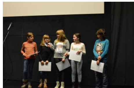
Nagrajenke na zaključni slovesnosti v Kinoteki

na to temo posnelo 18 filmčkov, pri čemer jim je pomagalo 14 mentorjev. Vse filmčke so si lahko v času trajanja festivala "Film proti korupciji" na računalnikih v preddverju ogledali obiskovalci Slovenske kinoteke, v pripravi pa je tudi spletno mesto natečaja, kjer bodo vsi filmčki trajno na voljo za ogled. Do tedaj si lahko filmčke ogledate tukaj .