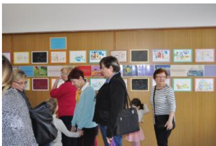
Zaključni dogodek v vrtcu Ivana Glinška v Mariboru

natečaju »Spoznavanje integritete skozi sliko in igro«, več o obeh natečajih pa si lahko preberete v tej številki Vestnika.